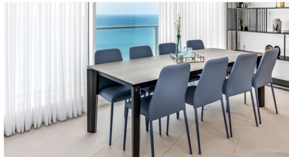
עיצוב פנים: שנית בר-חן

טיפ מנצח: לא חייב סט תואם, אפשר לשדרך שולחן לכיסאות אקלקטיים