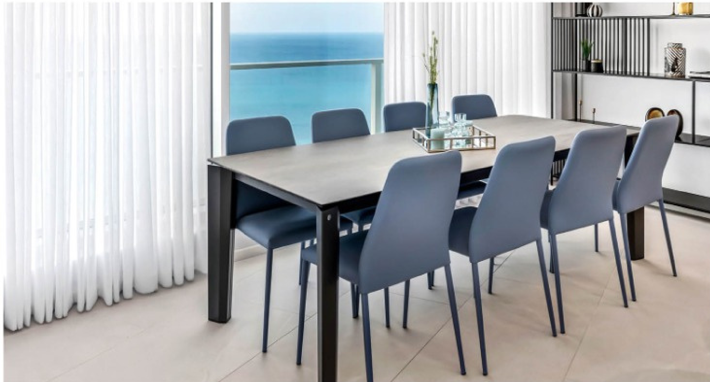
עיצוב פנים: שגית בר-חן, צילום: מאור מויאל