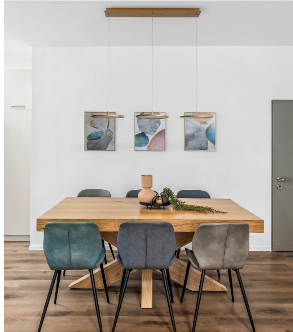
עיצוב פנים: שרון דוד

טיפ מנצח: לא חייב סט תואם, אפשר לשדרך שולחן לכיסאות אקלקטיים